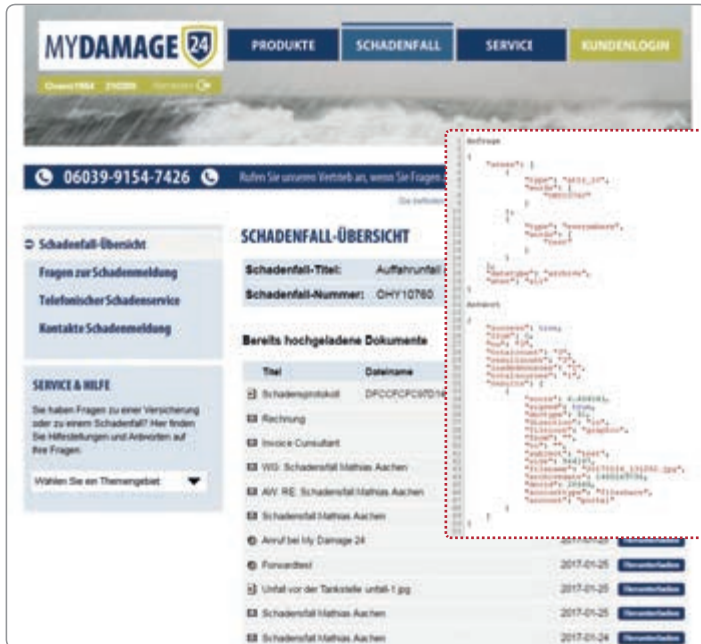
Einfache Umsetzung eines Schadensmeldungsportals einer Versicherung mit integriertem Dokumentenzugriff aus EMA®, der mit wenigen Programmierzeilen per SMART API/SDK erstellt wurde.