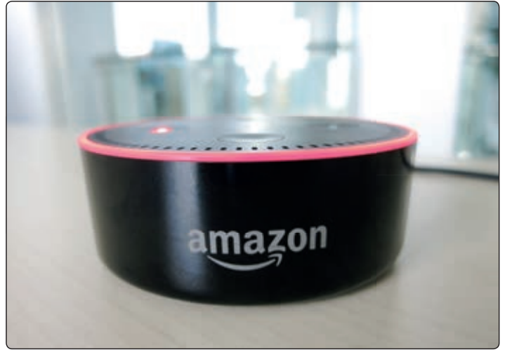
SMART API/SDK: Anbindung von Sprachassistenten an EMA®/VSTOR® am Beispiel von Amazons Echo über Alexa-Sprachsteuerung.